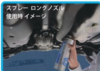
スプレー ロングノズル 使用時イメージ