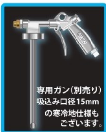
専用ガン(別売り) 吸込み口径15mm の寒冷地仕様も ございます。