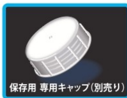
保存用 専用キャップ(別売り)