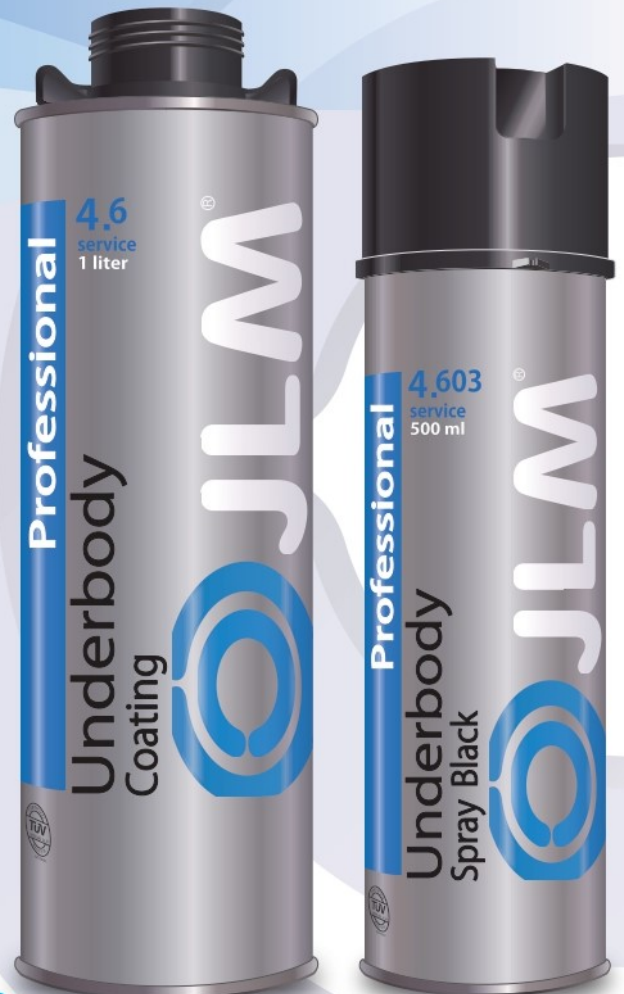
専用ガンタイプ仕様